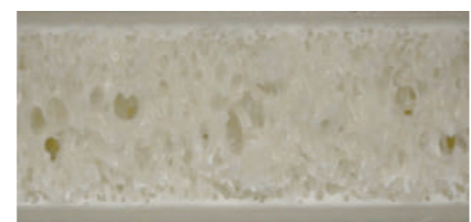
射出成形機の微細発泡成形例