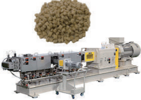
※詳細につきましては当社ホームページ『プレスリリース』をご覧ください。

トを繰り返しながら、薄物用延伸フィルム製造装置を実現しました。もうひとつの注目素材は、植物由来の素材、セルロースナノファイバー(CNF)です。木材の主成分セルロースから抽出した繊維状の材料で、鋼鉄の5分の1の軽さで5倍以上の強度があります。官民連携で製品化に取り組んでいますが、多くの処理工程が必要なため、高コストが課題です。当社では、素材メーカーと共同で開発を進め、二軸押出機を用いた一貫製造プロセスや複合樹脂化技術により生産性を向上し、実用化を加速させています。環境にやさしいだけでなく付加価値を高めた素材へ。リサイクルから新素材の考案への取り組みを下支えています。