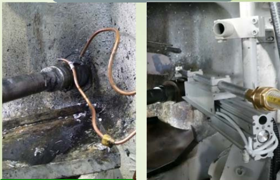
従来のプランジャ潤滑装置 Conventional plunger lubrication