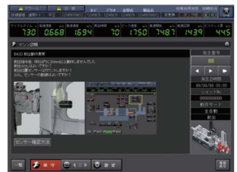
アラーム表示画面 Alarm display screen