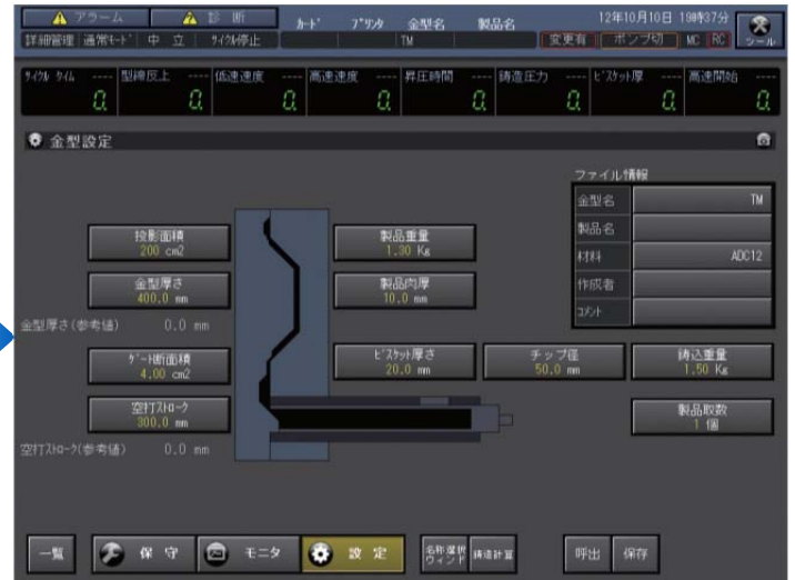
TOSCAST-888 (15インチ) TOSCAST-888 (15")