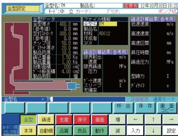
TOSCAST-555 (10.5インチ) TOSCAST-555 (10.5")

Increase in Screen Size and Design Improvement